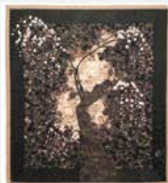
「綺麗さび したれ桜」