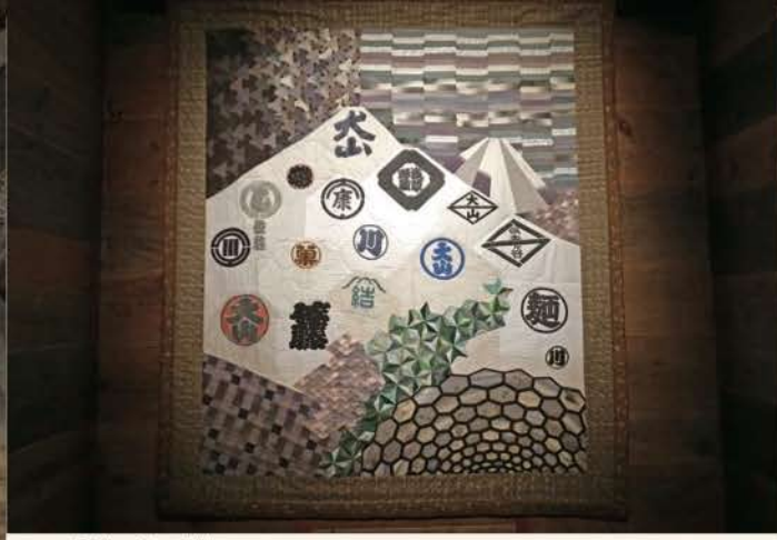
「大山ー行衣の記憶ー」

「行衣」を通じて大山詣りの歴史や魅力を伝承するために制作され、「行衣」へ敬意の想いが込められた作品です。