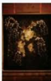
「綺麗さびしだれ桜」