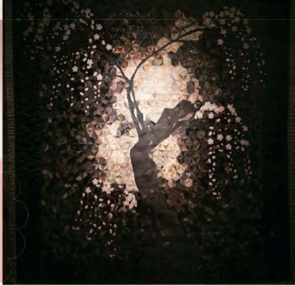
「綺麗さび しだれ桜」