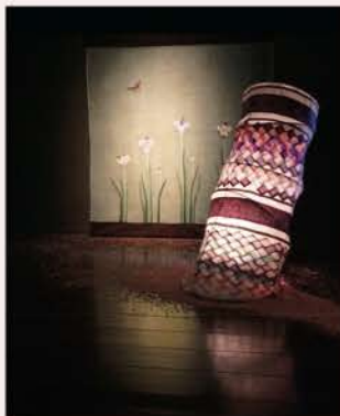
新作 行灯「花の明かり道」