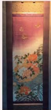
新作 掛軸「獅子と牡丹」