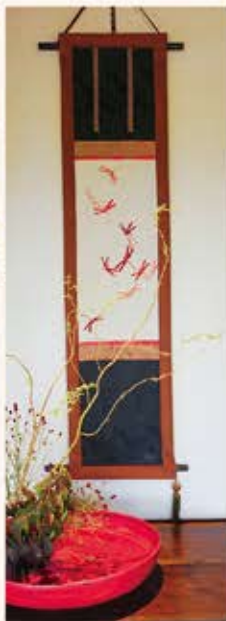
「あかとんぼ」(掛け軸)