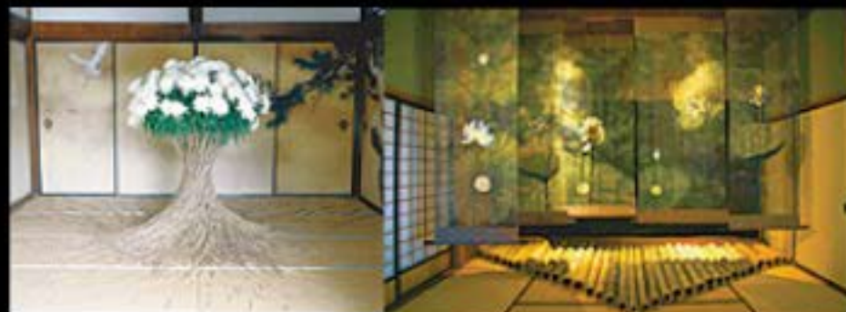
出雲 奉祝の花・ダニエルオスト 八幡垣・織アート